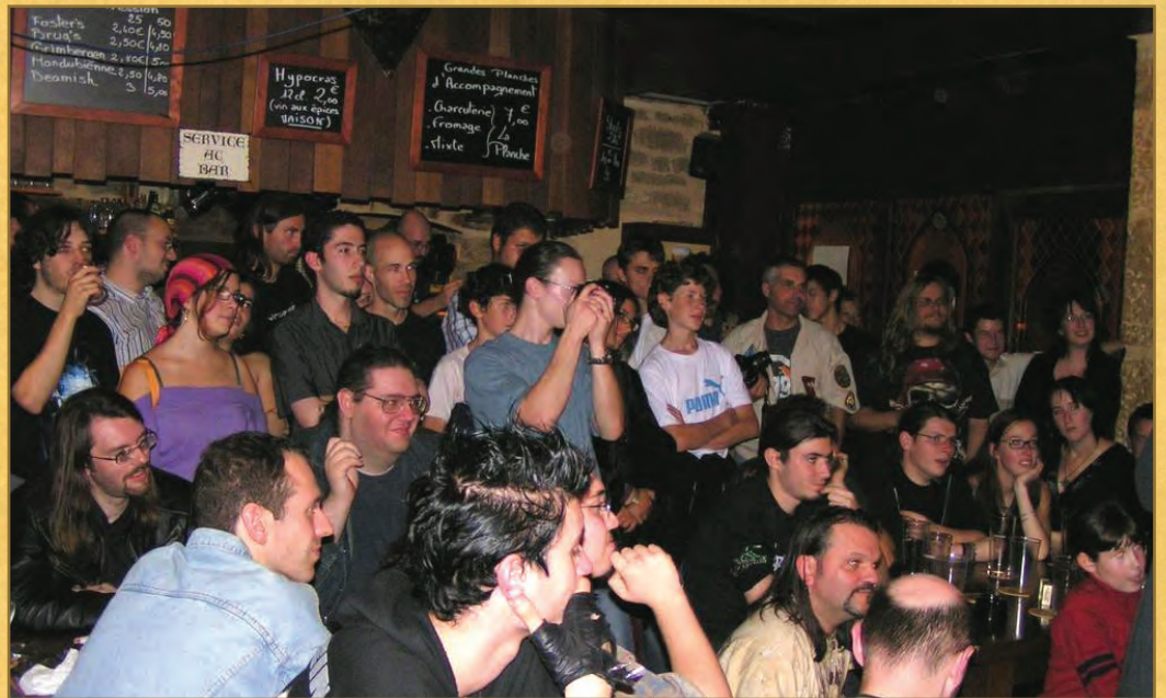
Même pour un concert privé, le Naheulband remplit les salles... D'habitude on est une vingtaine dans ce bar... Là on était 70 ! NdKhay : si vous cherchez bien, vous trouverez 6Klop et Kosan cachés dans cette photo.

ET ALORS ? T'ES ALLÉ FAIRE TON FANBOY ? COMME ÇA TU NOUS AS DÉGOTTÉ UNE INTER- VIEW ?