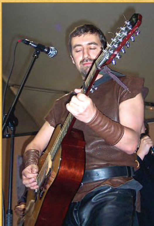
Apparemment, POC a joué dans Manowar. Il en a gardé quelques accessoires et une panoplie en cuir...

POC : Le souci c'est de toujours devoir s'excuser parce que tu ne produis pas, c'est surtout ça le problème. Evidemment, il y a toujours des mecs qui te disent « ouais mais moi la musique je m'en fous, je veux des épisodes ». Et je leur réponds « ouais mais les 900 personnes du concert d'hier, c'est de la musique qu'ils voulaient... ». Certes il y a moins de gens qui viennent nous voir en concert que de personnes qui téléchargent les épisodes, mais le rapport aux gens est totalement différent, et pour nous c'est quand même beaucoup plus sympa !