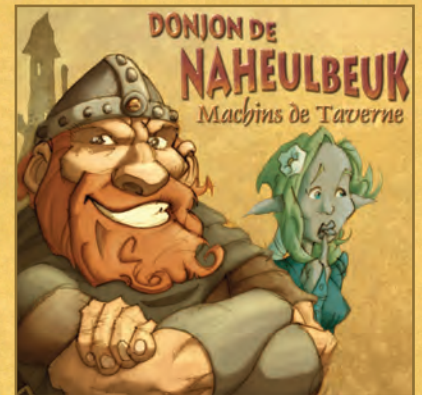
Le premier album : Machins de Taverne. Drôle, amusant et en plus il fait rire.

Et n'oubliez que le premier qui lui crie " Chaussette ", il lui met un front. Susceptible, parfois, le gars.