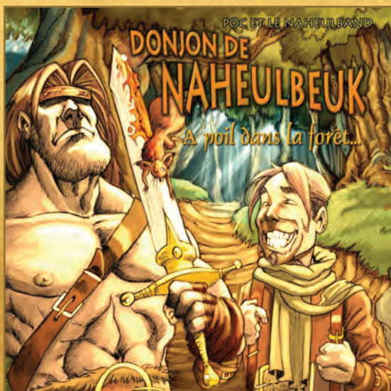
Le dernier album, actuellement en vente. Rigolo, cocasse, déridant. Et en plus il fait marrer.

Non... POC a bien vu que le Donjon de Naheulbeuk commençait à devenir culte un peu partout sur la planète (quand on a 50000 téléchargements par mois et que l'hébergeur menace de te buter au lance-flammes, on se doute d'un truc), il a donc décidé de faire quelques produits dérivés. Pas pour l'argent, car il a un métier et n'a pas besoin de ça, mais pour les fans qui le tannaient depuis longtemps. Et puis si quelqu'un sort des trucs sur le Donjon, autant que ce soit lui, non ? Il a fait faire des T-Shirts, tout d'abord. Bon, tout le monde fait ça, et ce n'est pas franchement très grave, ni très commercial. Ensuite il a continué à faire des concerts, et il a sorti... un album avec le groupe. Encore une fois, la musique n'est ni commerciale, ni pourrie par le marketing (le CD a été édité par une boîte d'édition de Jeux de Rôle !). Enfin il a fait éditer une Bande Dessinée basée sur les aventures de ses personnages... Là, c'est l'explosion. Ça se vend par milliers d'exemplaires. Dans le même temps, les joyeux drilles vont tourner au Québec avec le groupe (nommé le "Naheulband", au fait), preuve que la déconnade n'a pas vraiment de frontières. En 2005, il faut bien avouer que tout rôliste un tant soit peu "aware" a entendu parler de près ou de loin de Naheulbeuk.