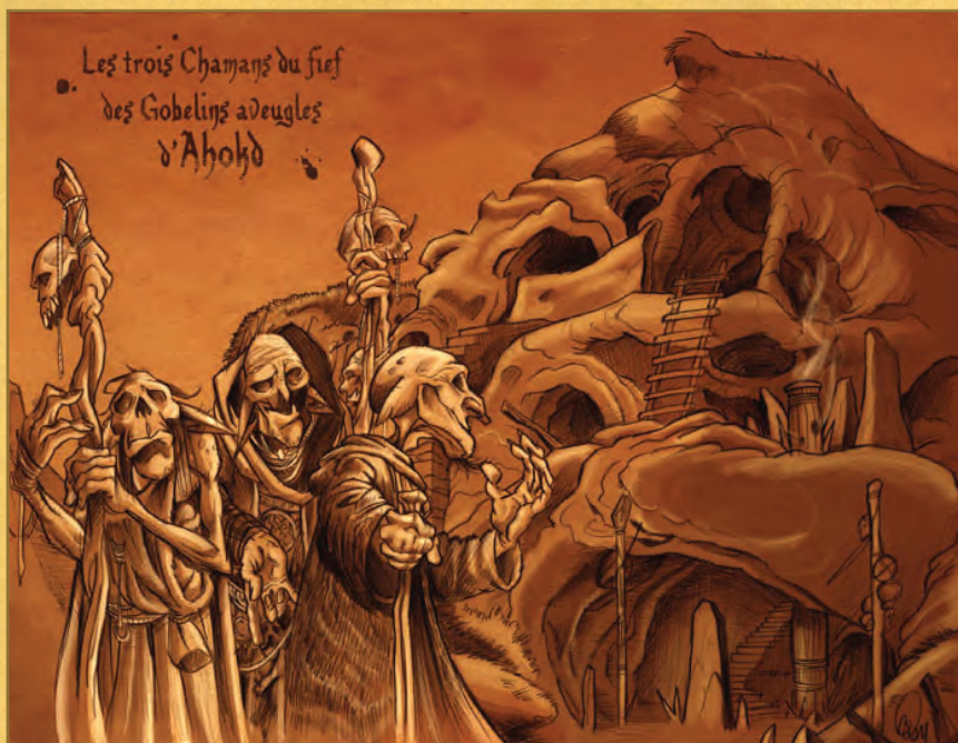
Les trois Chamans, en Gali... OK, je sors.

Surtout quand ils ont dit que le bar était trop petit pour faire un concert sonorisé, et que tout allait se faire en acoustique. Parce qu'un groupe en acoustique, ça n'a pas droit à l'erreur, tout bon musicien sait ça. Allaient-ils tenir leurs promesses ?